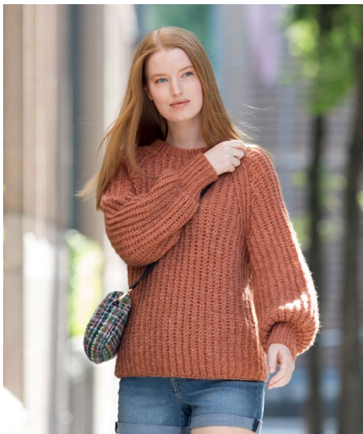
Se også i kobber | DG419-06