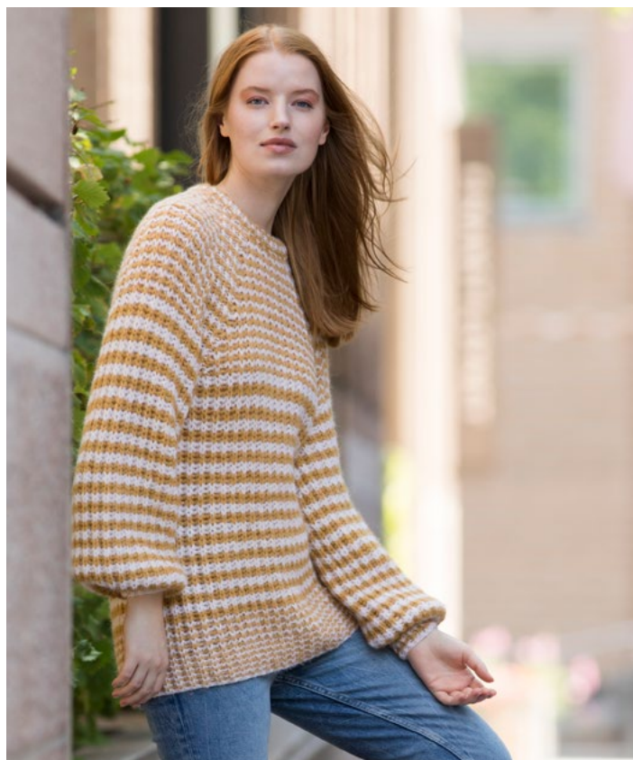
Se også med striper | DG419-05